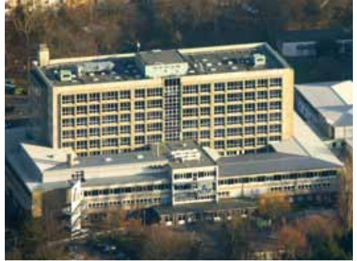
St. Anna Hospital und Marienhospital Herne Mitte

Mitte des Jahres fusionierten die St. Vincenz Gruppe Ruhr und die Stiftung Marienhospital Herne zur St. Elisabeth Gruppe – Katholische Kliniken Rhein-Ruhr. Entstanden ist eine Krankenhaus-Gesellschaft mit fünf Krankenhäusern, 1.561 Betten, 245.000 Patienten pro Jahr und rund 4.000 Mitarbeitern. Die St. Elisabeth Gruppe ist damit Hernes größter Arbeitgeber.